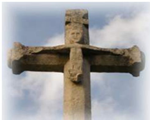
La croix du Machard Rue du Bady

Cette croix daterait du XVIIème ou du XVIIIème siècle