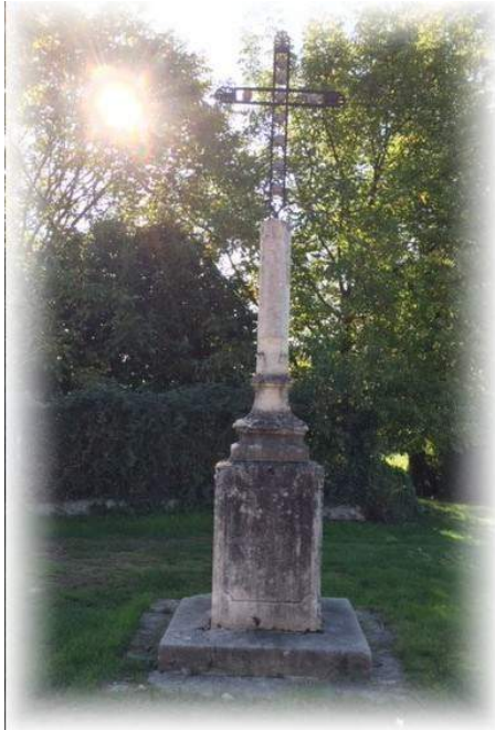
La Croix de la Botasse, ch. de la botasse