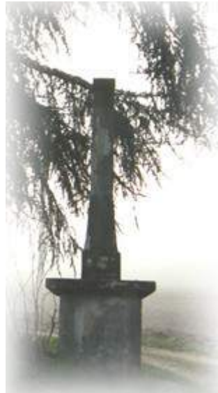
La Croix des Narcus Aux confins Nord de la commune. Son croisillon a été sauvé par M. l'abbé Nodet